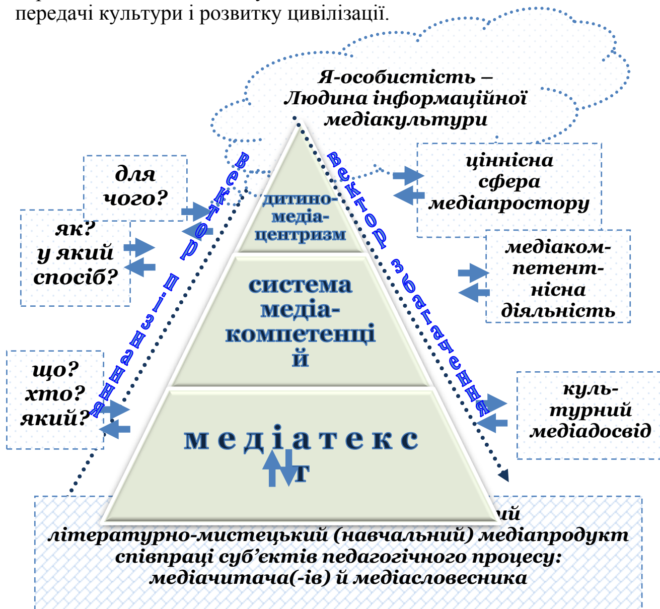
Рис. Медіоцентрична стратегія і тактика пізнання/збагачення людини та просторові складові для конструювання моделі сучасного уроку/заняття

4. Освіта через передачу інформації, її розуміння, сприйняття й засвоєння суб'єктами – один із основних способів передачі культури і розвитку цивілізації.