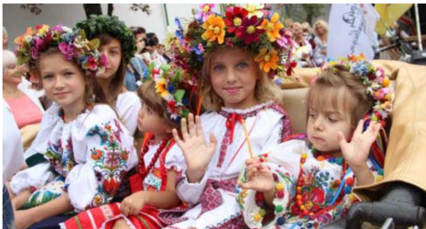
Рис. 1. Приклад фотозображення з серії «Символіка України».