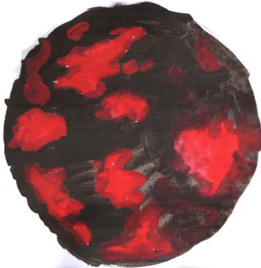
Рис. 3. Приклад мандали типу «Блаженство» , створеної після перегляду серії зображень «Майдан-АТО» .