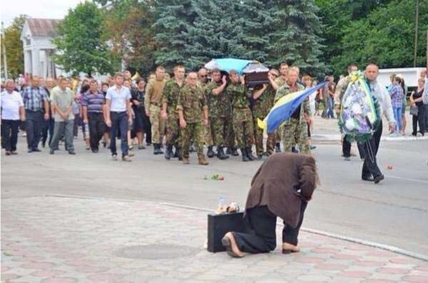
Рис. 3. Приклад фотозображення з серії «Герої не вмирають!».