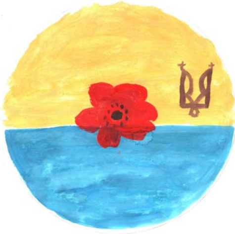
Рис. 1. Приклад мандали типу «Початок», створеної після перегляду