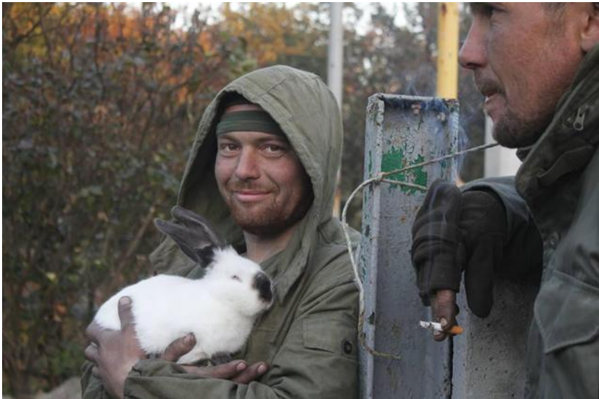
Рис. 4. Приклад фотозображення з серії «Все буде добре!».