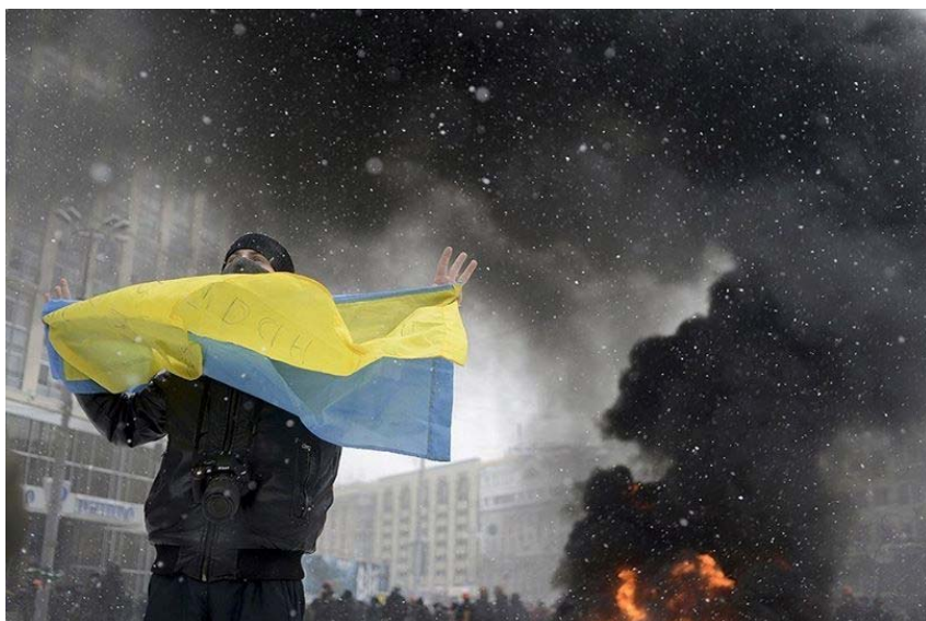
Рис. 2. Приклад фотозображення з серії «Майдан-АТО».