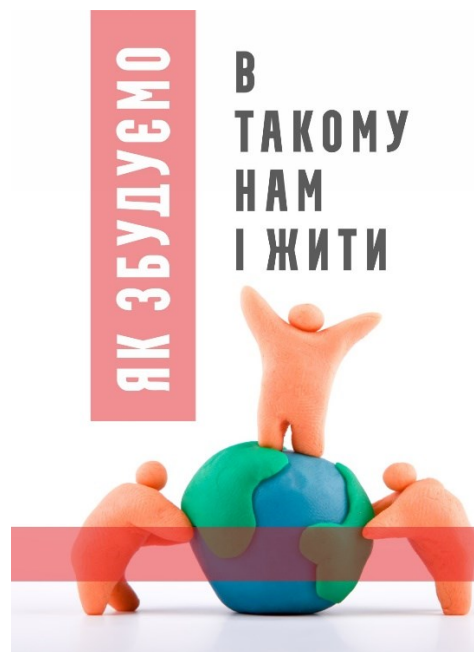
Комаренко Ольга 13

Фотографія-мотиватор «Вони знайшли спільну мову» – це історія органічного співіснування несумісного в природі. Дивлячись на світлину, ставимо питання: якщо камінь і квітка не заважають один одному, чому ж людина нищить людину?