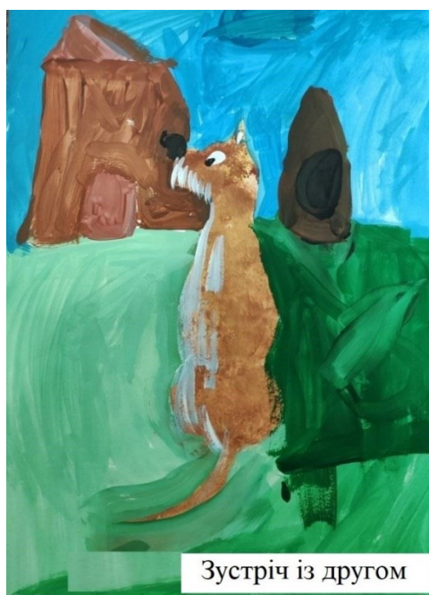
Шманін Артем, 6 років