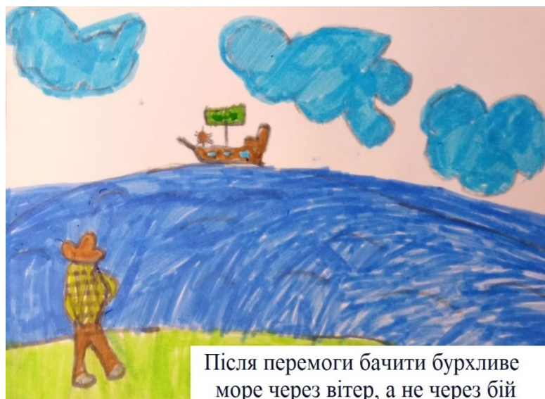
Староа Богдан, 8 років