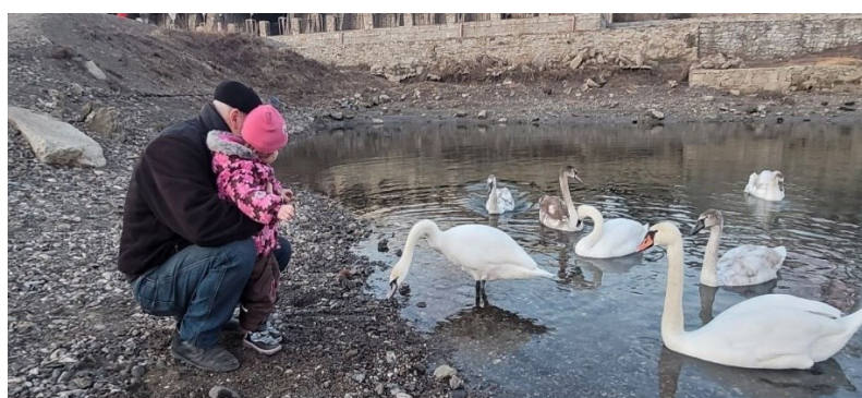
Як птахи повертаються щороку, так і ми повернемося до мирного життя