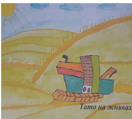
Маленький Анатолій, 7 років